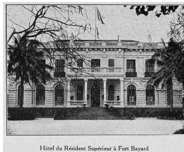
Hôtel du Résident Supérieur à Fort Bayard

Kouan-Tcheou-Wan était un territoire français cédé à bail par la Chine pour une durée de 99 ans par l'accord du 16 novembre 1898. Son centre administratif était Fort-Bayard (actuelle Zhanjiang ). En 1900, le territoire de Kouang-Tchéou-Wan passait sous l'autorité du gouverneur général de l'Indochine française. Il sera rétrocédé à la Chine, le 18 août 1945 et évacué par la France, le 20 novembre.