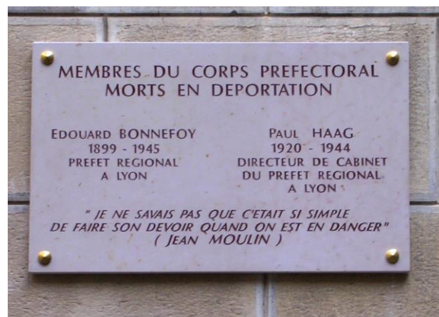
2011 Mise à jour novembre 2018 Michel Salager